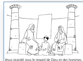
Jésus grandit sous le regard de Dieu et des hommes.